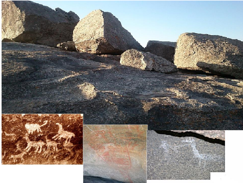
Figura 3. Pictografías del área Arroyos Dispersos.

La comarca rupestre tiene afinidad con los temas que suelen aparecer en el arte de las Sierras de Córdoba y San Luis pero no en total coincidencia ya que podría decirse que guardan una originalidad parcial que las dota de importancia patrimonial manifiesta. Una parte del inventario está en las figuras 2 y 3.