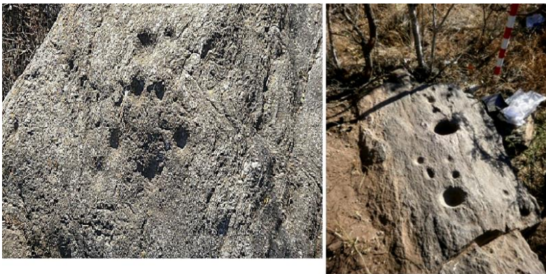
Figura 2. Petroglifos del área Piedra Blanca.