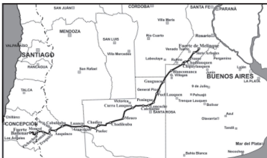
VIAJE DE DON LUIS DE LA CRUZ Y GOYENECHÉ DESDE EL FUERTE BALLEÑAR AL FUERTE DE MELINQUE (1806)