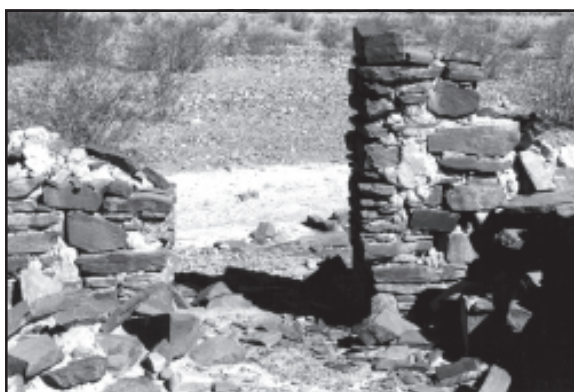
Figura 4 Vano de una estructura del sitio Alcaparrosa.