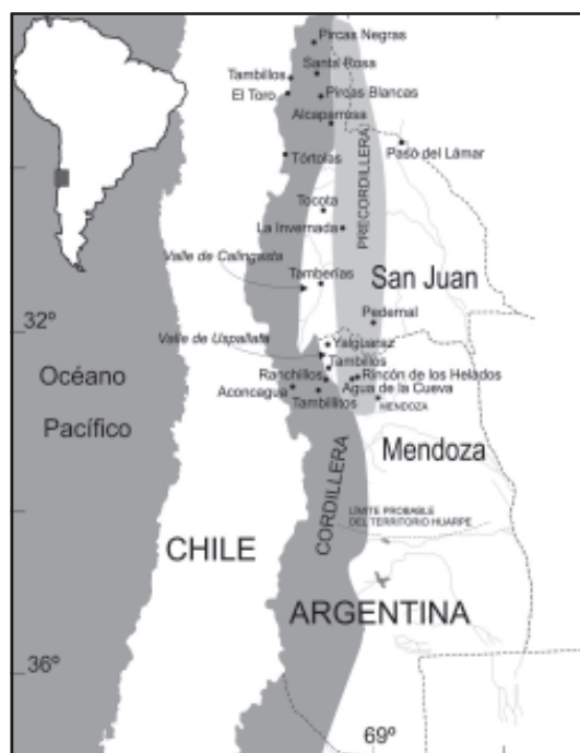
Figura I Principales sitios incaicos mencionados en el texto.

altura (Schobinger 2001). Sin embargo, sitios con ocupaciones del período inca también se han hallado en otros sectores, como el Valle de Uco (e.g. Lagiglia 1976, Sacchero y García 1988) y la precordillera (García y Sacchero 1989, García 2004b).