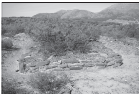
Figura 6 Sector inferior de los muros del «Cerro fuerte del Inga».