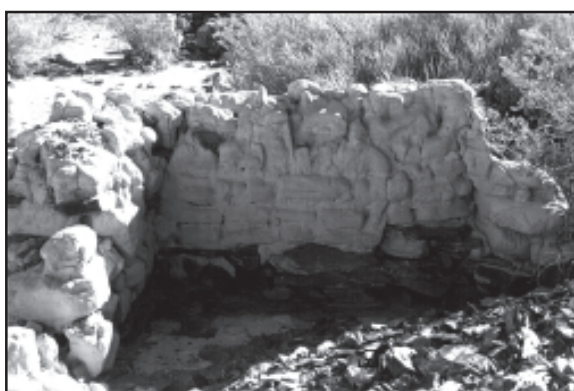
Figura 3 Estructura de adobe en el Tambo de la Junta o Alcaparrosa.

Lejos de mostrar una homogeneidad arquitectónica general, se observan diferencias de construcción importantes, tanto a nivel intersitio como intrasitio. Algunos tambos presentan importantes diferencias de construcción en sus estructuras. Por ejemplo, en Alcaparrosa (Figura 3) se observan diversos sectores con construcciones de diversa complejidad arquitectónica, de muros con y sin argamasa, y construcciones con muros de adobe con y sin cimientos de roca (García et al. 2007; Bárcena 2008). También se han señalado las diferencias constructivas de algunos sectores de Ranchillos (Bárcena 1998).